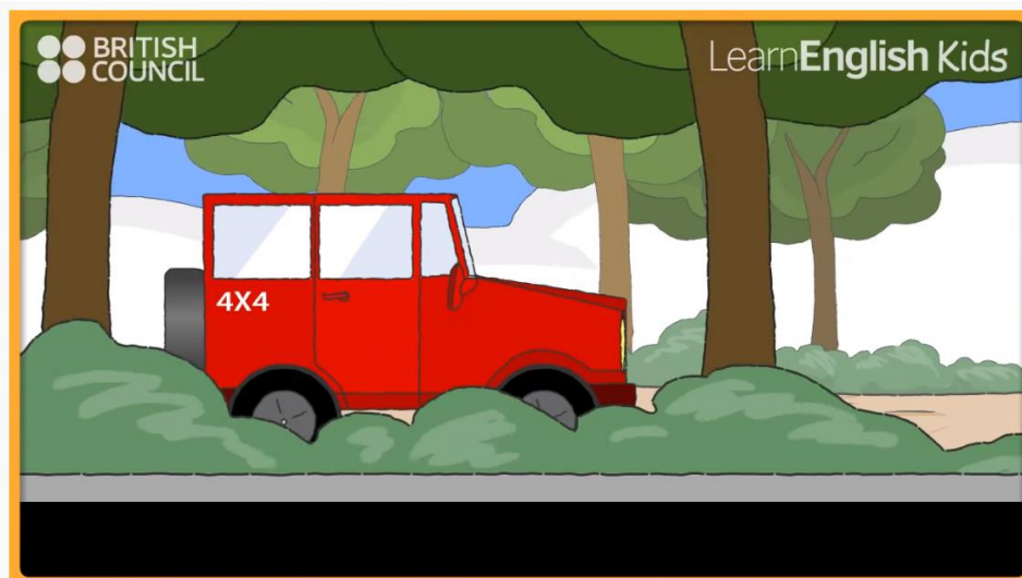
Over the mountains - Nursery Rhymes & Kids Songs - LearnEnglish Kids British Council

https://www.youtube.com/watch?v=GzrjwOQpA10