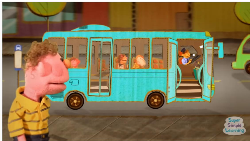
SUPER SIMPLE SONGS - VIDEO COLLECTION, VOLUME 2 1. sezona • 2. epizoda The Wheels On The Bus | Super Simple Songs

3. TRANSPORT. PONOVI ŠE PREVOZNA SREDSTVA. NAJPREJ PESMICI, KI JU ŽE POZNAŠ. POJ IN PLEŠI! ☺