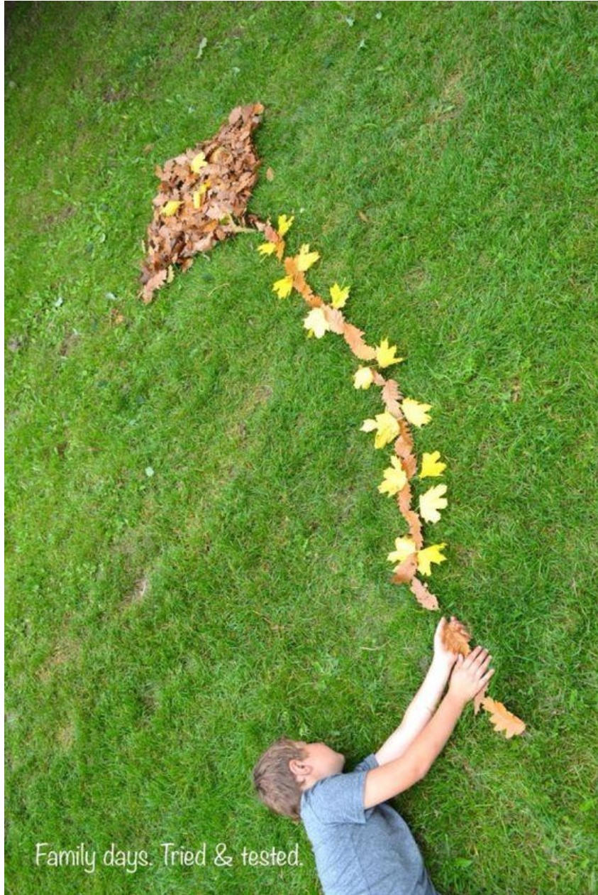
Family days. Tried & tested.