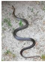
KAČA SE PLAZI.