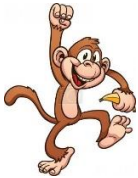
OPIKA VISI NA VEJI.

OPONAŠAJ GIBANJE ŽIVALI TUDI TI. NAJDI ŠE KAK SVOJ PRIMER. NALOGE LAHKO OPRAVIŠ V STANOVANJU, HIŠI, LAHKO PA SE ODPRVIŠ TUDI VEN IN KAKŠNO OPRAVIŠ TUDI NA SVEŽEM ZRAKU.