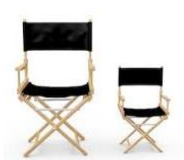
STOL – STOLČEK

DOBRO SI OGLEDJ SPODNJE SLIKE. KAJ OPAZIŠ? SE STOLA MEDSEBOJ RAZLIKUJETA? JA RES JE, EN JE MANJŠI KOT DRUGI. MANJŠE PREDMETE POIMENUJE DRUGAČE KOT VELIKE. POIMENUJ JIH.