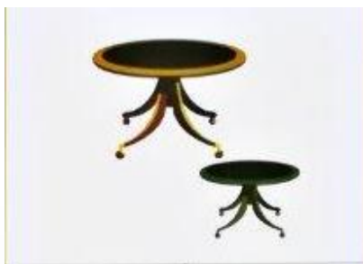
MIZA – MIZICA