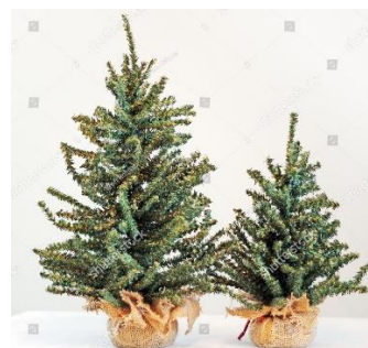
SMREKA – SMREČICA