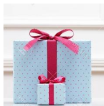
DARILO – DARILCE