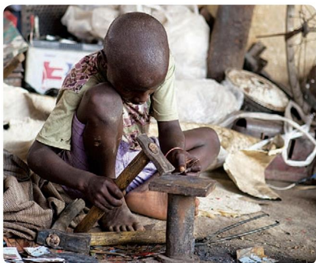
Prisilno delo otrok