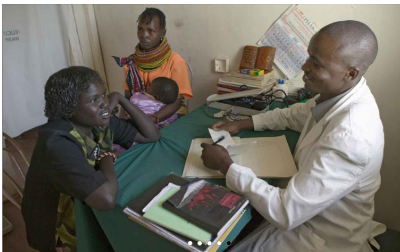
V nekaterih predelih sveta prebivalci nimajo dostopa do zdravstvene oskrbe. Umirajo zaradi bolezni, ki so ozdravljive.