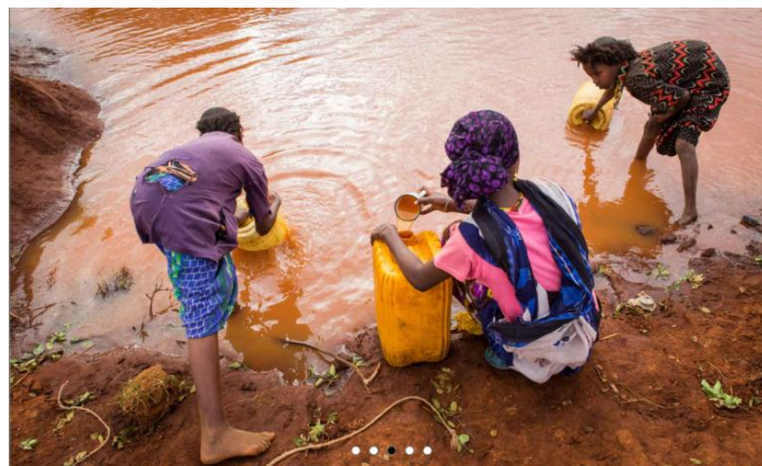
Nekateri še vedno nimajo dostopa do čiste pitne vode.