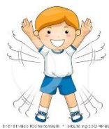
POSKOKI - ZVEZDA