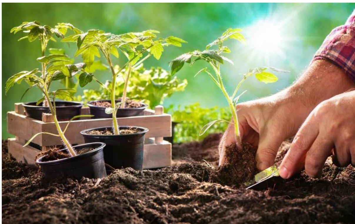
SADIMO PARADIŽNIK - SADIKE